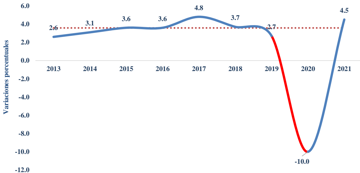
Gráfico 1. Crecimiento Económico de Honduras, 2013 - 2021

Fuente: Elaboración propia con base a datos del Banco Central de Honduras.