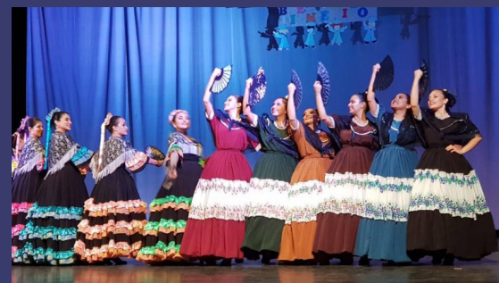
Integrantes del grupo folclórico Arte y Ciencia.

las 7:00 de la noche realizarán la decimotercera gala cultural virtual. Además se desarrollarán tres conferencias dedicadas al folclor y a la danza en su generalidad. Mediante la participación en este evento, los estudiantes acumularán horas del Artículo 140 como requisito de graduación.