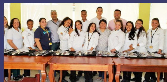
Estudiantes universitarios que participaron en el Programa Avanza Honduras.

Centroamericana y la Universidad Cristiana Evangélica Nuevo Milenio (UCENM). Cabe resaltar que bajo esta alianza entre el Proyecto Avanza y las tres universidades hondureñas se logró que más de 430 estudiantes completaran sus estudios, de la misma manera se le otorgó becas a 109 de ellos.