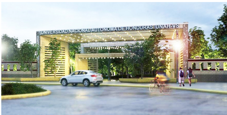
Fachada de la Universidad Nacional Autónoma de Honduras en el Valle de Sula (UNAH-VS).

serie de mejoras que vendrán a darle una cara distinta a ese centro de estudios, en un esfuerzo titánico de la UNAH por mejorar su infraestructura. Esta información se sustenta en un informe brindado por SEAPI, del proyecto denominado: "Construcción de muro perimetral y portales de acceso en UNAH-VS, según contrato de construcción No. CC-04-2017-SEAPI-UNAH", que desglosa el contrato por sección hasta la modificación No.12.