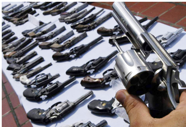
El contenido completo de la transmisión del panel está en la dirección electrónica: facebook.com/NDIHonduras .

La percepción de peligrosidad es una de las razones para