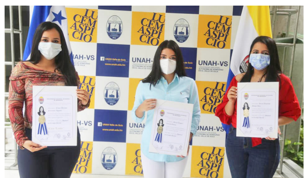
Tres egresadas de UNAH-CUROC muestran con orgullo su título universitario.

démicas se otorgaron a egresados de las siguientes carreras: 2 de Ingeniería Agroindustrial, 10 de Comercio Internacional, 3 de Administración de Empresas, 10 de Administración de Empresas Agropecuarias, 7 de Pedagogía y Ciencias de la Educación, 1 Técnico Universitario en Microfinanzas y 5 Técnicos Universitarios