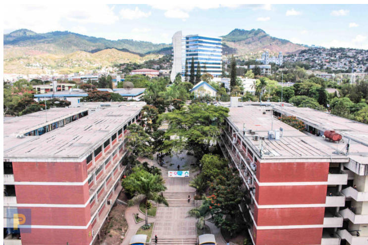
Campus de la Universidad Nacional Autónoma de Honduras (UNAH).

Aquellas instituciones que decidan hacer procesos de pilotaje en clases o laboratorios que requieren de presencialidad, deberán presentar su petición para la respectiva aprobación ante el Sistema Nacional de Gestión de Riesgos, (SINAGER) y cumplir con los requisitos establecidos.