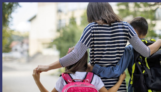
Un 43.7% de los hogares liderados por madres solteras están en las ciudades del país.

La baja existencia de V. thylene en el país sustenta el hecho de que es una especie no común en Honduras, pero dichos registros actualizan su distribución en el norte del país.