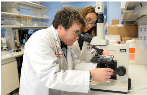
María Elena Bottazzi y Peter Hotez dirigen el Centro para Desarrollo de Vacunas del Hospital Infantil de Texas.

Bottazzi es decana asociada de la Escuela Nacional de Medicina Tropical, profesora de pediatría y codirige el desarrollo de la vacuna contra la COVID-19, en la Escuela de Medicina de Baylor de Houston, Texas, EE UU.