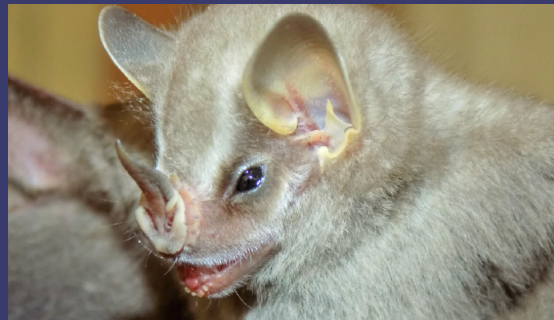
Acceda a este enlace: https://fb.watch/5k00Y3da7a/ , para ver la entrevista completa.

"El arte de la lutería se trata del amor y la pasión que se siente por crear los instrumentos", dijo Mendoza.