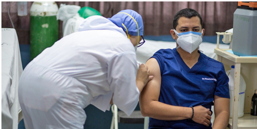
Personal de salud aplica con prioridad la vacuna contra la COVID-19 a médicos y enfermeras.

Se aplicarán vacunas de AstraZeneca y de Sputnik V, según la Secretaría de Salud.