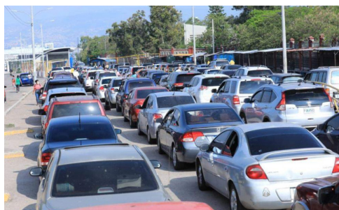
Este tiempo fue calculado en horas pico.

destacar que en la estación de vacunación para una persona se avanza más rápido que en las demás estaciones. Para llegar a esta conclusión, se tomaron 5 puntos de referencia.