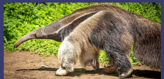
La Reserva de la Biosfera del Río Plátano (RPBR, por sus siglas en inglés), representa la región más importante de Honduras para la conservación de la biodiversidad en el país.

tridactyla (Pilosa: Myrmecophagidae ) en el núcleo de la Reserva de la Biosfera del Río Plátano", indica que el grupo de investigación de Herrera et al. en 2011 confirmó la presencia de esta especie en El Venado, Gracias a Dios y Gonthier y Castañeda en 2013, lo situó en el Río Sikre, entre otras localidades vecinas.