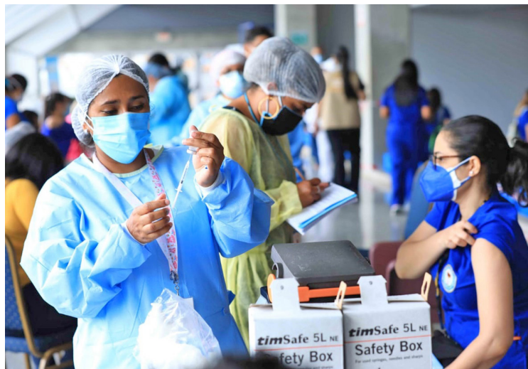
En el Palacio Universitario se realizó la inoculación de los estudiantes universitarios.

El proceso de inoculación contra la COVID-19 está dirigido a los estudiantes de V y VII año de las carreras de Medicina, Microbiología, Química y Farmacia, Enfermería y Odontología de universidades públicas y privadas que realizan su práctica profesional en hospitales del país.