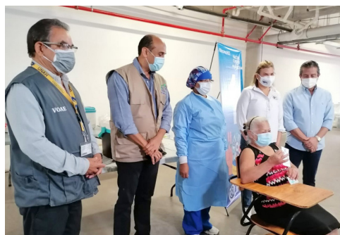
UNAH prestó sus instalaciones para la aplicación de la vacuna AstraZeneca.

Nacional de Jubilaciones y Pensiones de los Empleados y funcionarios del Poder Ejecutivo (Inju Kemp). En este sentido, funcionarios del IHSS agradecieron el apoyo humano y logístico prestado por la Universidad Nacional Autónoma de Honduras (UNAH) durante