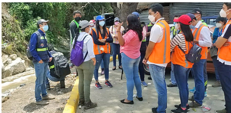
La Facultad de Química y Farmacia analiza fundar la Escuela de Alimentos.