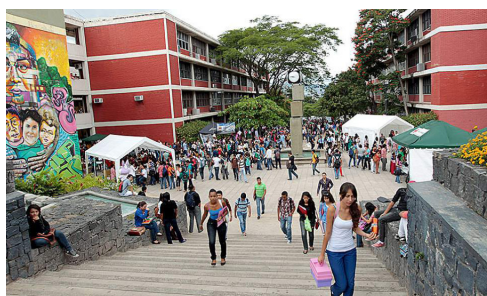
Esta es la primera vez que una universidad hondureña logra estar entre las 1,300 a nivel mundial.

La última edición del ranking mundial de universidades del Quacquerelli Symonds (QS) World University Rankings 2022 posiciona a la Universidad Nacional Autónoma