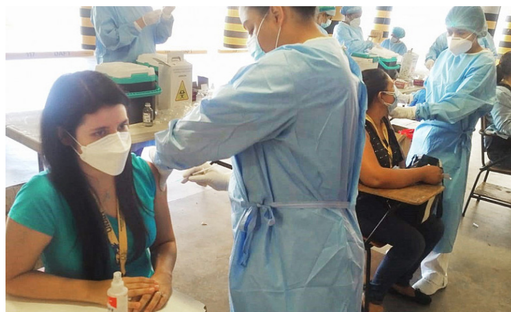
Empleados de la UNAH recibieron su primera dosis de vacuna contra la COVID-19