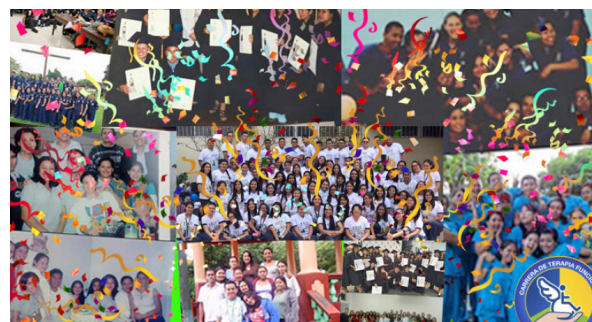
Imágenes de la Carrera Técnico Universitario en Terapia Funcional.

egresados, así que para mí es muy satisfactorio", expresó el doctor Madrid. Durante estos 24 años, se entregó al sistema de salud pública unos 422 nuevos profesionales con estudios de nivel superior, que atienden en áreas de ortopedia, pediatría, neumología y fisiátrica, entre otras.