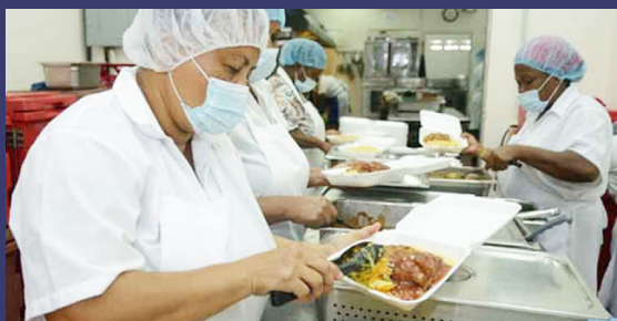
El campus del CURC está situado en Comayagua.