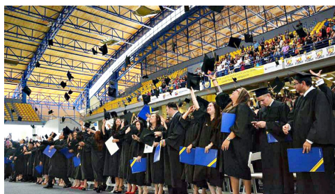
Ceremonia de graduación en el Polideportivo de la UNAH.

Es de notar que el 56% del ingreso estudiantil a la UNAH son mujeres y el 44% son hombres. La población femenina lidera los porcentajes de ingreso y egreso en la UNAH.