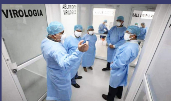
Más de un millón de hondureños han sido vacunados contra la COVID-19.