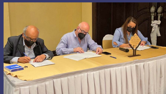
Los actos protocolarios se desarrollaron en un hotel capitalino.