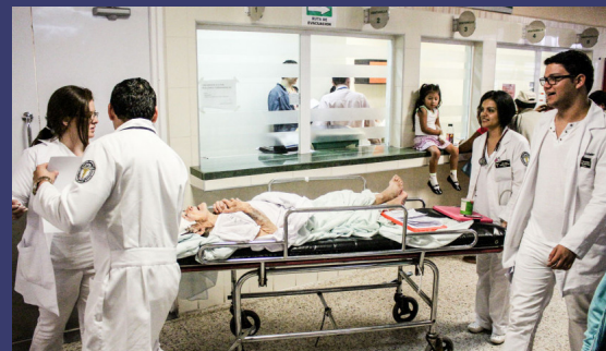
El diplomado es impartido por la Facultad de Ciencias Médicas.