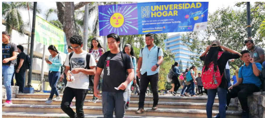
Los estudiantes universitarios elegirán a sus representantes mediante voto electrónico.

avanzó en la elaboración de un nuevo Cronograma Electoral Provisional, tal como lo manda el artículo 12 del Reglamento Electoral Estudiantil (REE). En el mes de julio, continuó, la CTE envió el documento de propuesta de un Cronograma Electoral Provisional a la JEN, con base en el REE, tuvimos una reunión el 20 de julio entre ambos órganos para discutir la propuesta debido que el reglamento manda que se debe llegar a un consenso, allí conocimos que el cronograma tuvo muy buena aceptación por parte de la JNE, ellos quedaron que la iban a revisar.