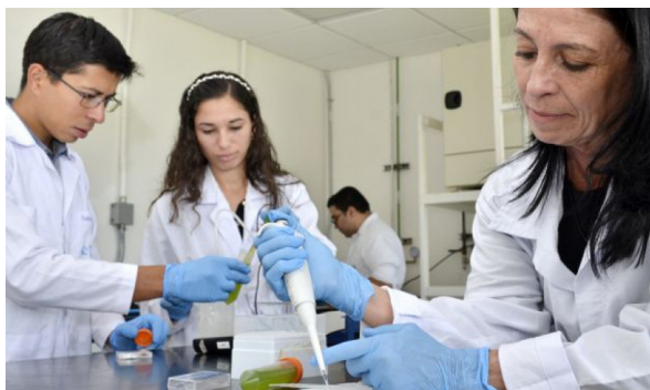
La investigación y los posgrados están intrínsecamente relacionados.

Cambio climático y gestión ambiental. Acceda al siguiente enlace para tener mayor información de este evento: https://fb.watch/7mpgS4erUj/ .