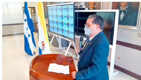
El académico cuenta con 43 años de experiencia adquirida en el sector educativo público y privado.

En 1982 fue profesor de la UNAH y en 1991 fungió como coordinador de la Carrera de Física y laboró para la Escuela Agrícola Panamericana, según su hoja de vida.