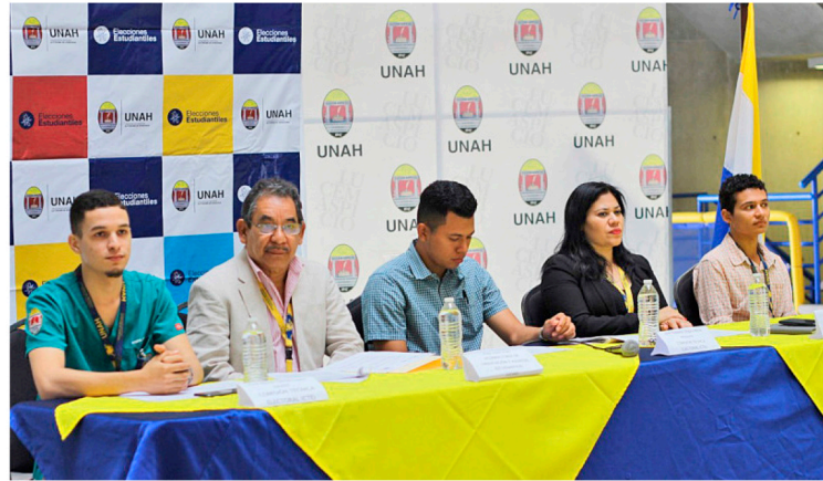
La entrevista completa de este proceso electoral la puede ver en el siguiente enlace: https://fb.watch/7LUw-W594/ en donde representantes estudiantiles brindaron declaraciones al respecto a medios universitarios.

La Junta Electoral Nacional (JEN) realizará