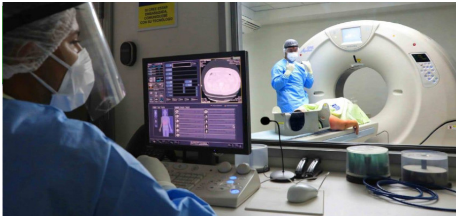
Los protocolos fueron elaborados por la SEDI y son aplicados en el CDIBIR, Palacio Universitario de los Deportes y en otras instalaciones de la UNAH.

que labora en las unidades de Rehabilitación e Imágenes Biomédicas, para brindar herramientas útiles y de guía para una atención de calidad a pacientes y evitar al mismo tiempo el riesgo de contagios de COVID-19". También, los protocolos de uso y manejo del equipo con el propósito de manejar correctamente y de forma segura el equipo al momento de brindar los servicios que ofrecen, ampliando con ese cuidado la vida útil del equipo y manteniendo un alto índice de operatividad. Desde mayo de 2021 se elaboraron estos reglamentos que ya se encuentran en su versión final, informó.