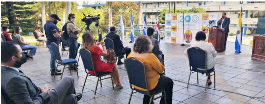
La actividad se desarrolló de forma presencial y virtual.