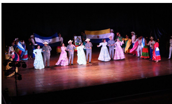
“Reinventándonos para generar esperanza y alegría”, fue el lema del festival.

participantes interesados en la promoción de una ciudad más incluyente y sostenible. “Como comisión organizadora nos da mucha alegría llegar a este momento”, expresó.