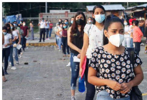
Miles de aspirantes de todo el país realizan la PAA.

20 al 24 de septiembre. Weinberg (EE UU) ganó en 1979 el Premio Nobel de Física junto con Abdus Salam y Sheldon Lee Glashow, por combinar el electromagnetismo y la fuerza nuclear débil en el modelo electro-débil.