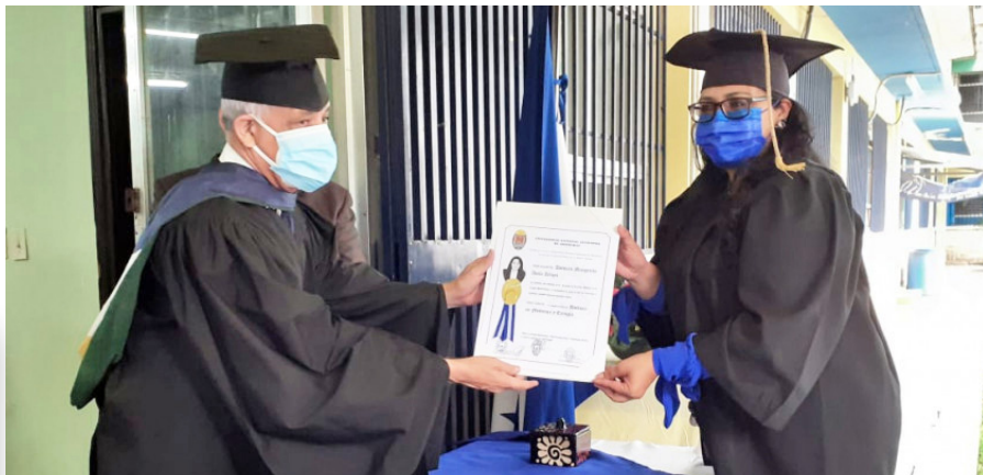
La entrega de títulos de Medicina, Enfermería, Nutrición, Terapia Funcional y Radiotecnología entre otras se realizó en la Facultad de Ciencias Médicas, con la observación de un estricto protocolo de bioseguridad.

Menciones honoríficas: Se otorgaron 12 medallas Summa Cum Laude que se entregan por egresar con índices en el rango de 95-100%, 95 medallas Magna Cum Laude (90-94%) y 673 medallas Cum Laude (80-89%).