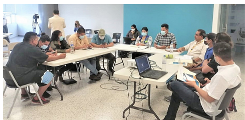
Reunión entre miembros de órganos electorales de la UNAH.