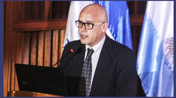
Sierra es un académico e intelectual hondureño.