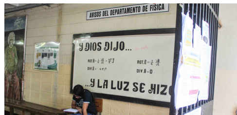
La Carrera de Física fue creada en 1967.