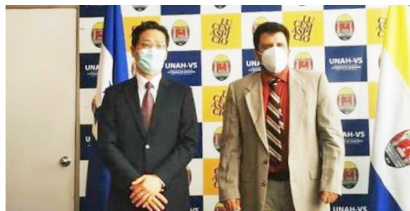
El cónsul de Taiwán visitó el campus de UNAH-VS.

Las partes prevén que estas oportunidades estarán a disposición de la comunidad universitaria entre enero y febrero del año próximo, para que los interesados cumplan con el proceso de postulación a las becas.