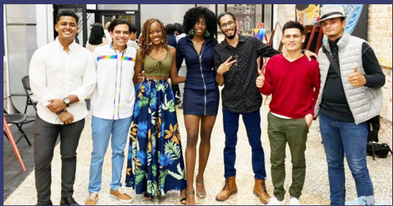
Universitarios que participaron en el evento.