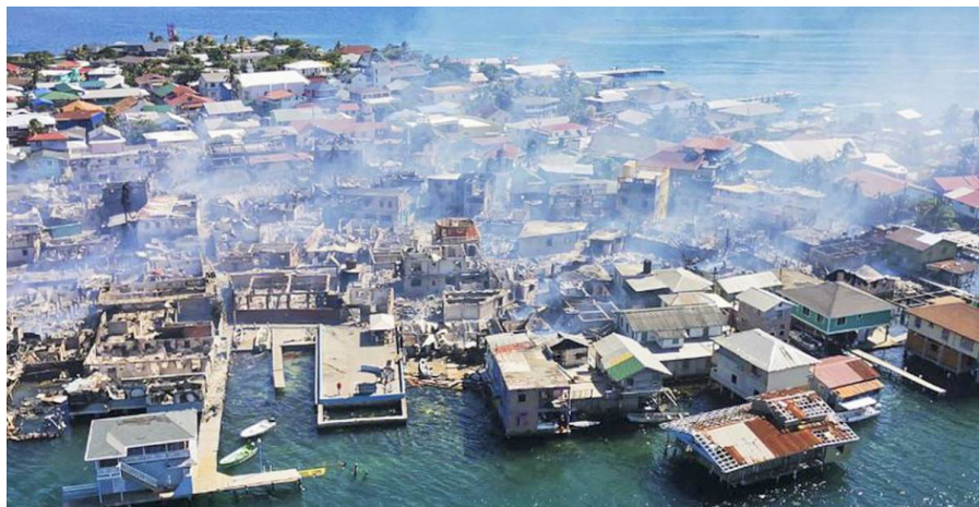
El incendio ocurrió el 2 de octubre del presente año en la Isla de Guanaja.

vés de su cuenta de Twitter el rector Francisco Herrera Alvarado. De manera previa se anunció que se colaborará en la elaboración de un diseño habitacional diferente, con todas las medidas posibles para evitar desastres futuros como el ocurrido.