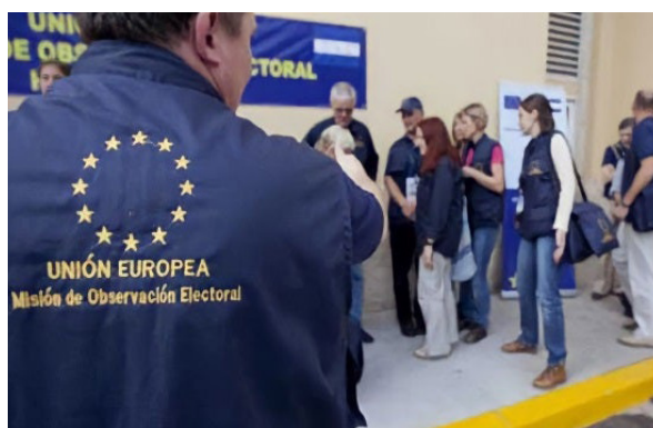
MOE-EU destacó el buen comportamiento de la población durante las elecciones.

La Misión reconoció que la renovación del documento de identidad en todo el país contribuyó a mejorar el censo electoral que, a su vez, generó más confianza que en elecciones anteriores, "ya que se eliminaron duplicados y personas fallecidas", afirmaron.