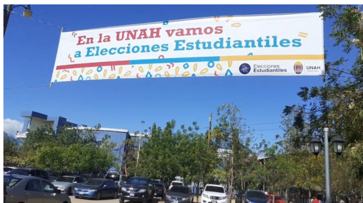
Según Irias, un beneficio de la votación electrónica es que se puede realizar de forma remota por medio de un celular o computadora.

planificado invertir en el proceso electoral, con esta metodología, vamos a gastar 300,000-400,000 lempiras porque es extremadamente económica la inversión; eso va a procurar un ahorro a la universidad de casi 5.5 millones de lempiras", aclaró Irias. Referente a las Elecciones Generales Honduras 2021, Herrera expresó que la UNAH, mantuvo una postura de incentivar a la población para que votara por los candidatos de su preferencia de manera ordenada.