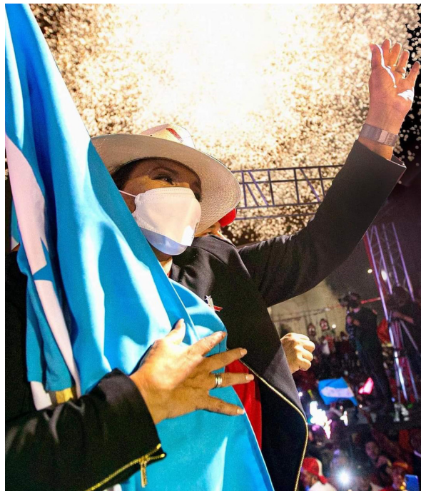
Iris Xiomara Castro Sarmiento es actualmente la única mujer presidenta en la región latinoamericana.

Desde 1946 las mujeres exigieron el derecho a votar y en el presente año, Honduras eligió a la primera mujer que gobernará la nación por los próximos cuatro años.