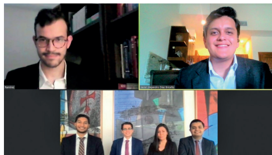
Los cinco estudiantes de la UNAH junto con su coach.

a instituciones de educación superior de México, Argentina, Brasil, Suiza, India, Francia y Serbia, destacando Honduras como el único país de latinoamericana que logró entrar en el top 8 de la competencia.