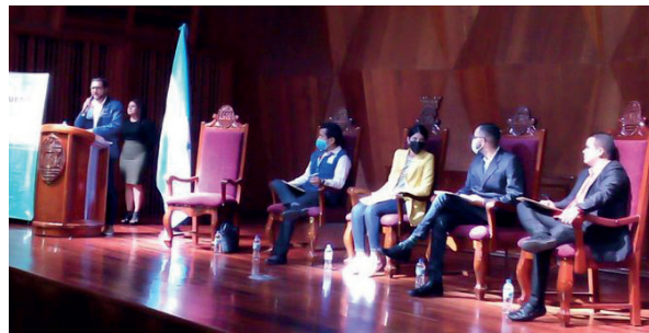
La presentación se efectuó en Ciudad Universitaria.

yecto se propugna crear espacios de participación para la juventud, donde se puedan abordar temas específicos entre el gobierno y la sociedad civil, y ejecutar desde el marco de la ley, un plan de desarrollo integral en sus comunidades. Se pretende, también, facilitar a los jóvenes la posibilidad de encontrar empleo y fomentar la creación de redes de apoyo con organizaciones civiles o públicas.