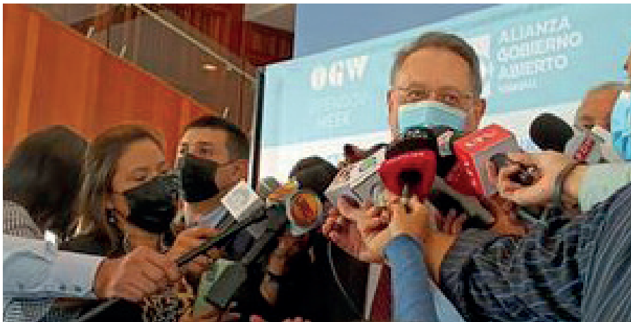
El evento se desarrolló en Ciudad Universitaria.