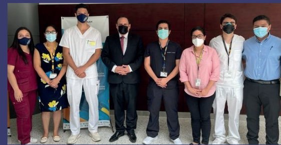
La reunión se efectuó en la UNAH.