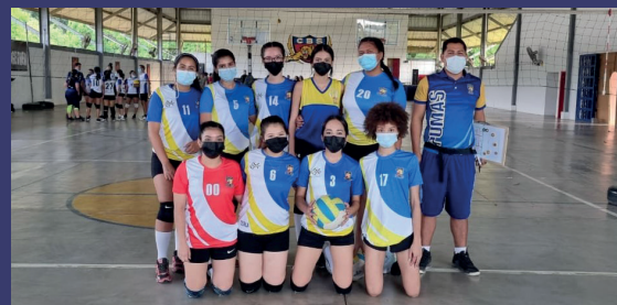
El equipo de volibol femenino del CURLA se creó en 1990.

proyectos en conjunto, sobre todo en el área de la salud y la iniciativa de crear un Complejo Hospitalario Universitario, el cual pretende apoyar la red hospitalaria nacional, asimismo contribuiría al área de la odontología, farmacia, microbiología, ingeniería biomédica, así como la investigación.