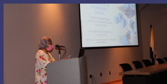
La segunda edición del congreso se llevará a cabo en junio del 2023.