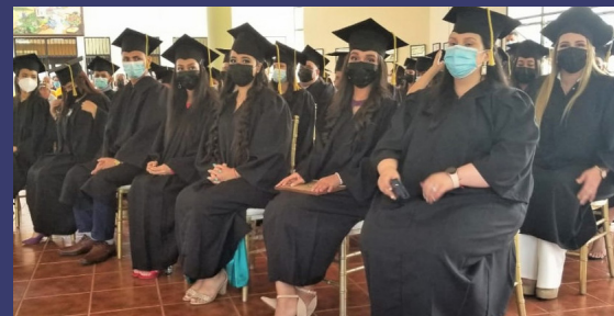
11 graduados recibieron medalla Magna Cum Laude, dos Summa Cum Laude y 94 Cum Laude.