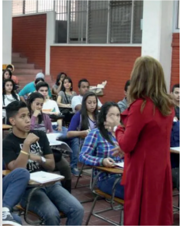
Una docente imparte clases a estudiantes en Ciudad Universitaria.

El ingreso a la carrera docente se accede en la UNAH, de manera única vía concurso, recalcaron autoridades académicas.