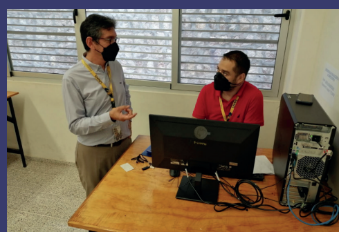
Momento que el jefe del Departamento de Arquitectura evaluaba las últimas computadoras pendientes a instalar en el edificio de aulas C3,

directora de la OEI para Honduras, Nicaragua y Guatemala, quien además reconoció la credibilidad y peso de la UNAH en la región centroamericana, y lo que eso implica. "Ha sido largo el camino que hemos recorrido con la UNAH para el cumplimiento del fortalecimiento de las competencias de los docentes", dijo.