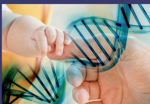
Para la toma de muestra de sangre no se necesita ninguna preparación previa o ayuno.

"Como es la primera semana donde se hace la presentación de sílabos y de asignación de ejercicio diagnóstico, se tomó la decisión arrancar clases del 13 al 15 de julio de 2022 de manera virtual, y estaríamos arrancando con las clases presenciales a partir de la semana del 18 de julio", indicó Castellanos.