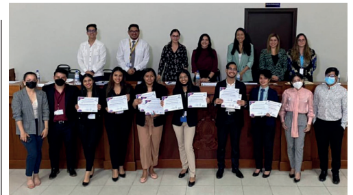
Estudiantes de la Facultad de Ciencias Jurídicas muestran sus diplomas.

10 para la Carrera de Lenguas y 25 dedicadas para el Centro de Lenguas Extranjeras. En cada aula se atenderá aproximadamente a 20 estudiantes, docentes y sociedad en general que requiera aprender y certificarse en determinada lengua.