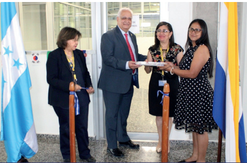
El Centro de Lenguas está situado en el edificio 1847, Ciudad Universitaria.

su discurso, todo ello luego que las autoridades desfilaron al compás del Himno Nacional, interpretado por el Coro y ejecutado por la orquesta de la Carrera de Música para entregar el Pabellón Nacional y el resto de las banderas centroamericanas a los estudiantes de excelencia académica que acompañaron la ceremonia. Durante la disertación afirmó además que "La intelectualidad debe ponerse al servicio de la nación", en aras del desarrollo de Honduras.