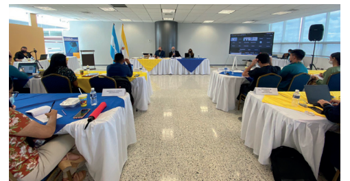
Reunión de Consejo Universitario.

El Consejo Universitario aprobó recursos presupuestarios para la constitución de la Federación de Estudiantes Universitarios de Honduras (FEUH) y a la realización del próximo Congreso Estudiantil Universitario. "Se aprobó también la creación de una cuota fija a la matrícula de cada estudiante de 45 lempiras", esto sin incurrir