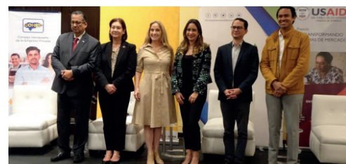
El índice de competitividad del Golfo de Fonseca es de 53.6 y del Litoral Atlántico: 53.3.

El Índice de Competitividad Regional de Honduras, presentado por primera vez, muestra que 2 de las 4 regiones del país, alcanzan niveles de competitividad arriba del 60%. Honduras ocupa la posición 101 de índice de competitividad de 141 economías del mundo. La investigación la realizó el Instituto de Investigaciones Económicas y Socia-