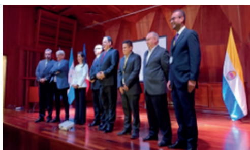
Autoridades de la UNAH y de la OPS durante el evento.

Con el foro denominado "Plan de acción y estrategia de epilepsia", la Universidad Nacional Autónoma de Honduras (UNAH) y la Organiza-