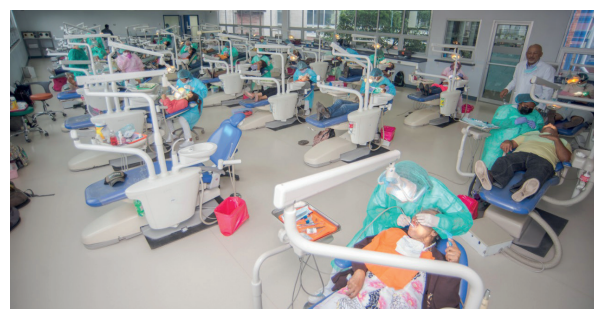
Clínicas de la Facultad de Odontología.

con el desarrollo de una carrera de doctorado propia y generar el desarrollo de ejercicios que contribuyan a la producción de conocimiento en las Ciencias Biomédicas y a la mejora de las condiciones de salud de la población. Durante los próximos meses se prevé el desarrollo de una serie de