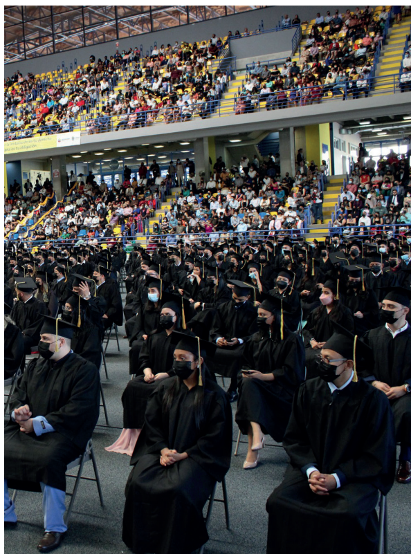
Padres de familia e invitados especiales acompañaron a los graduados durante la ceremonia realizada en el Palacio Universitario de los Deportes.