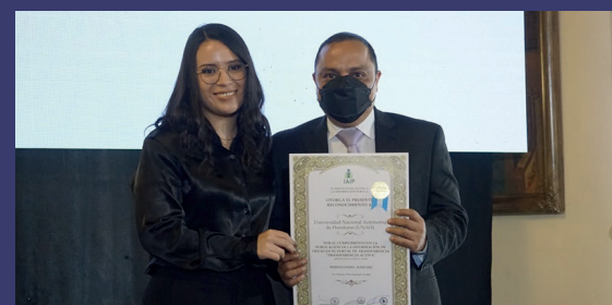
Funcionarios de la UNAH recibieron el reconocimiento del IAIP.