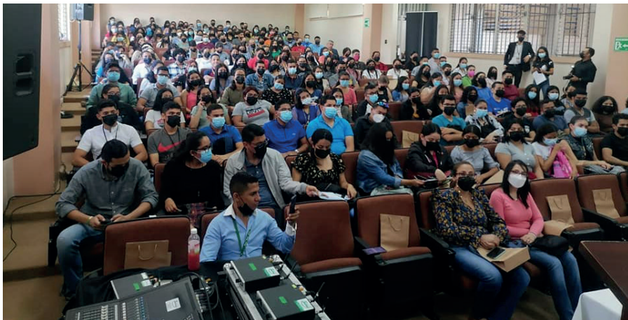
Estudiantes de la carrera de Banca y Finanzas durante conferencia sobre El seguro: una cultura de previsión que genera desarrollo.