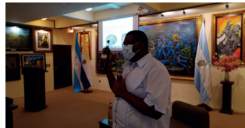
Se resaltó el talento artístico de nuestra comunidad académica.

sario en cuanto a espacios con acceso a Internet y con toda la seguridad posible. "Ellos tienen la responsabilidad de escoger a los hondureños más connotados y capacitados para ocupar las magistraturas de la CSJ", dijo el rector.