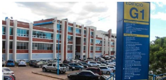
Instituto de Investigación de la Facultad de Odontología de la UNAH.

El programa de doctorado cuenta con la colaboración de empresas con base biotecnológica que subvencionan proyectos de investigación dentro de las líneas prioritarias del programa, con el fin de disponer de un marco adecuado para la consecución y transmisión de avances científicos.