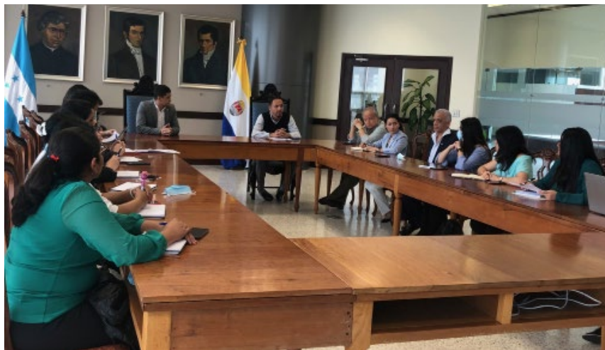
La agenda inició con la lectura de las cartas de entendimiento.

Con el objetivo de oficializar y establecer nuevas alianzas estratégicas con la UNAH, por medio de la docencia, investigación y vinculación, ejecutivos de la Agencia de Regulación Sanitaria, ARSA, se reunieron con autoridades de la máxima Casa de Estudio.