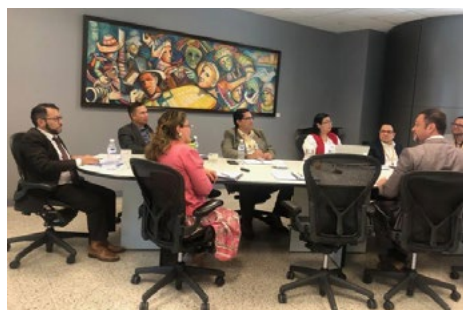
Los comisionados de la CCG, efectuaron una presentación al pleno de la JDU, sobre temas de interés general.

La Universidad Nacional de San Antonio Abad del Cusco fue fundada el 1 de marzo de 1692.