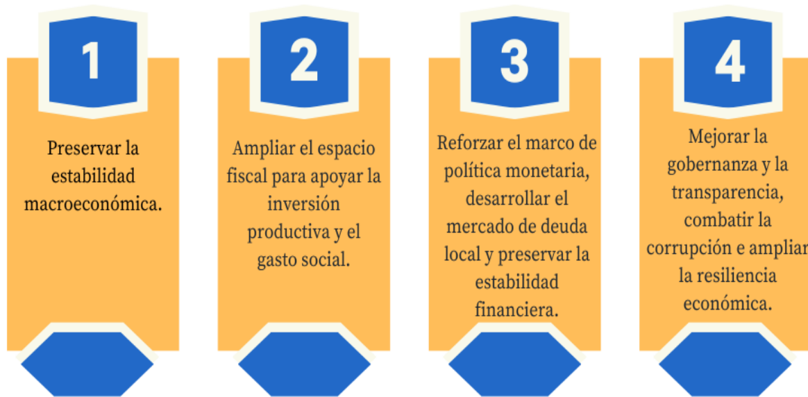
Figura 3. Principales componentes del Acuerdo de Servicio Ampliado entre FMI – Honduras, 2023